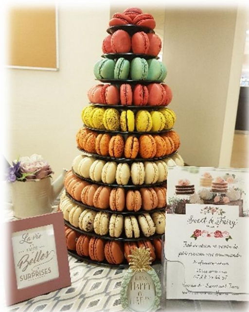
PYRAMIDE DE MACARONS